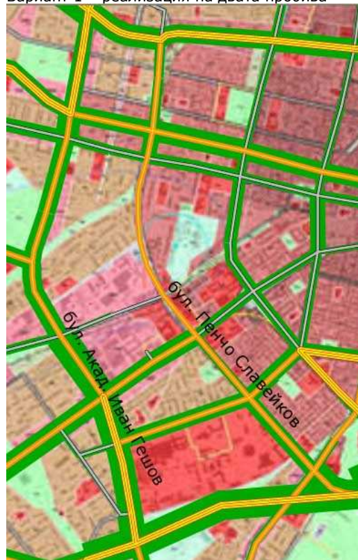
Вариант 2 – реализация само на единия пробив