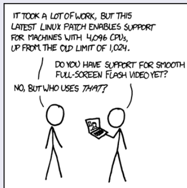
xkcd: Supported Features